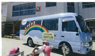
市内50か所以上を まわっています!